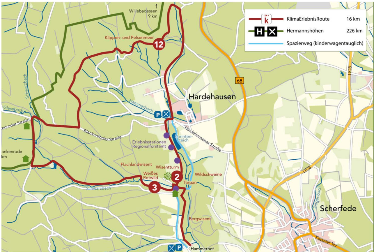
Flyer „Klima erleben Hardehausen“, abrufbar unter www.naturpark-teutoburgerwald.de

Der Einstieg in die zweietappige Tageswanderung mit der kleinen privaten Wandergruppe erfolgt am Sonntagmorgen zunächst im Bereich Klippen- und Felsenmeer nördlich von Hardehausen .